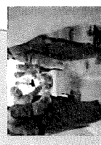
原子力災害医療 療体前の整備