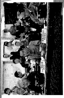
原子力総合防災訓練の様相